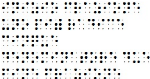
Figura 4: Scrittura in Braille della frase "inizio frazione uno più radice cinque denominatore due fine frazione"

Utenti disabili visivi possono anche utilizzare editor classici per leggere e scrivere testi in LaTeX. Tra questi, quello caratterizzato dalla migliore accessibilità è TeXnicCenter. L'editor risulta pienamente utilizzabile mediante tecnologie assistive, ad eccezione di alcuni menù, come il menù "Build", dove le finestre sono accessibili ma con alcune difficoltà. Inoltre, anche la finestra "Build Output", dove in fase di compilazione vengono segnalati eventuali errori, è raggiungibile mediante screen reader con difficoltà, ma una volta raggiunta risulta accessibile. Si segnala l'esistenza del software gratuito "latex-access" che consente di attivare (a discrezione dell'utente) la lettura delle formule in linguaggio naturale direttamente nell'editor TeXnicCenter.